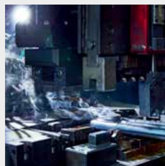
Сварка коллекторов с трубами