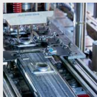
Точное изготовление половинок коллекторов