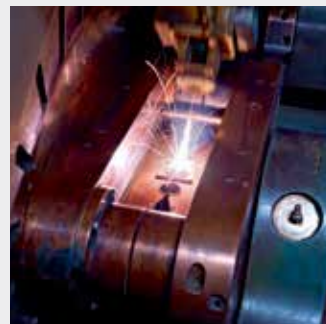
Лазерная сварка коллекторов